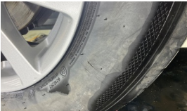
Lastik, sağ ön > Aşınmış