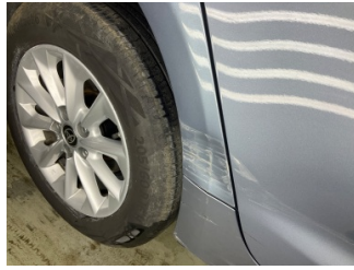
Çamurluk, sağ arka, Çamurluk, sağ arka > Hasarlı