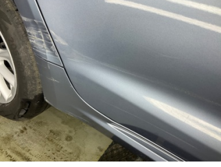
Kapı, sağ arka, Kapı, sağ arka > Ezik