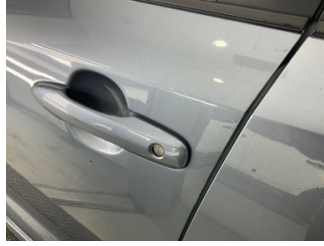
Kapı, sol ön, Kapı, sol ön > Ezik