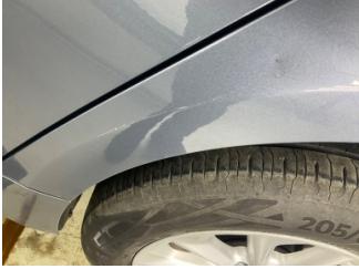
Çamurluk, sol arka, Çamurluk, sol arka > Çizik