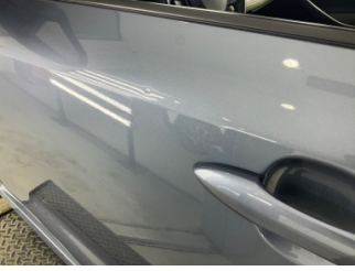
Kapı, sol ön, Kapı, sol ön > Ezik