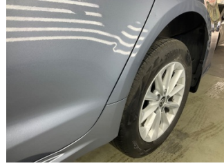
Kapı, sol arka, Kapı, sol arka > Ezik