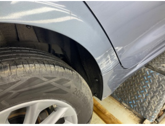
Çamurluk, sağ arka, Çamurluk, sağ arka > Hasarlı