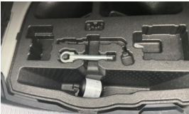
Lastik tamir seti > Eksik