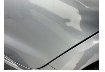
Kapı, sol arka, Kapı, sol arka > Ezik