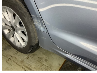
Kapı, sağ arka, Kapı, sağ arka > Ezik