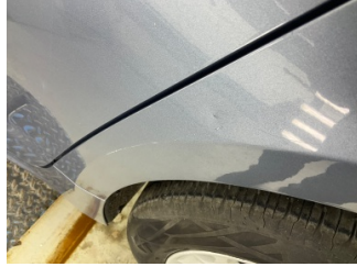
Çamurluk, sol arka, Çamurluk, sol arka > Çizik