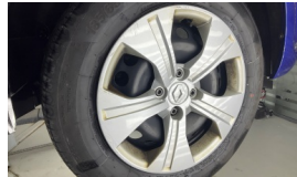
Jant kapağı seti > Çizik