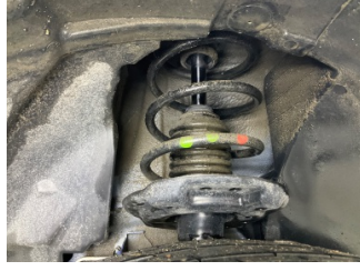
Ön aks, Amortisör körüğü, sol > Hasarlı