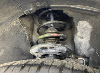
Ön aks, Amortisör körüğü, sağ > Hasarlı