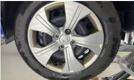
Jant kapağı seti > Çizik