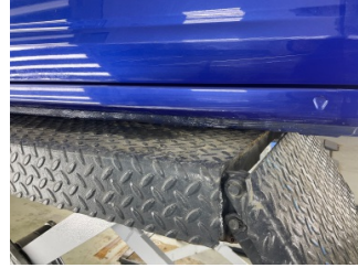
Marşbiyel, sağ, Marşbiyel, sağ > Çizik