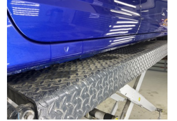
Marşbiyel, sağ, Marşbiyel, sağ > Çizik