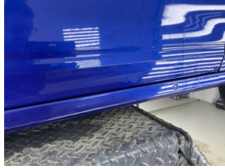
Kapı, sağ ön, Kapı, sağ ön > Çizik