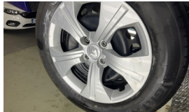
Jant kapağı seti > Çizik