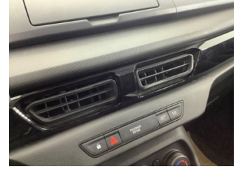
Kalorifer/Klima, Havalandırma ızgarası > Hasarlı