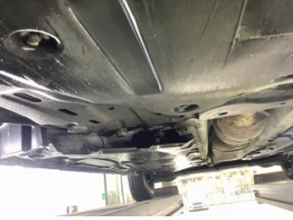
Kaporta, Muhafaza, orta > Hasarlı