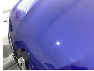
Motor kaputu, Motor kaputu > Taş Vuruğu