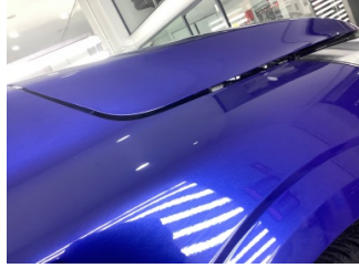
Çamurluk, sağ, Çamurluk, sağ > Küçük Çizik