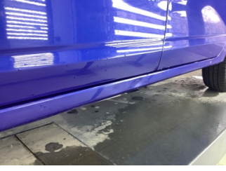
Marşbiyel, sol, Marşbiyel, sol > Ezik