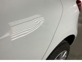
Kapı, sol arka, Kapı, sol arka > Ezik