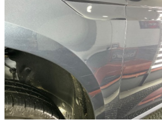
Çamurluk, sol, Çamurluk, sol > Çizik