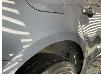
Çamurluk, sağ arka, Çamurluk, sağ arka > Çizik