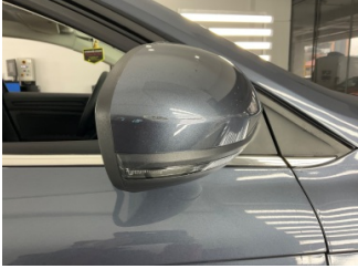
Dikiz aynası, sağ, Dış dikiz aynası kapağı > Çizik