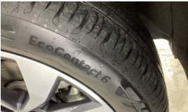
Lastik, ön > Aşınmış