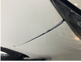
Tampon, ön, Ön tampon > Sabitlemesi Hatalı