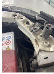
Kaporta, Ön Panel > Hasarlı