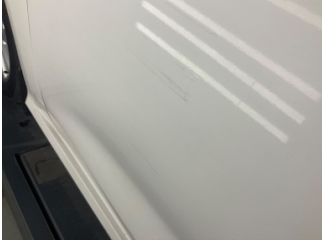
Kapı, sol ön, Kapı, sol ön > Çizik