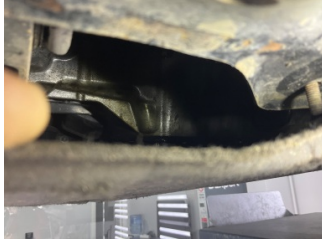
Motor, Motor > Yağ Kaçağı