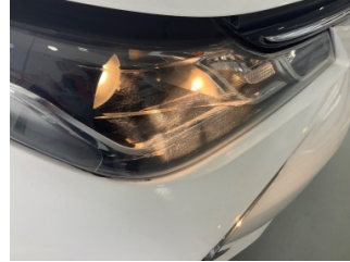
Farlar, Far camı, sağ > Çizik