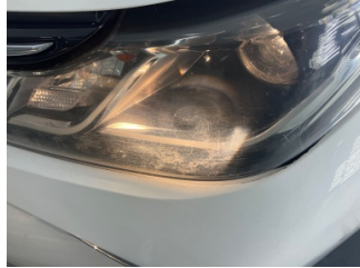
Farlar, Far camı, sol > Çizik