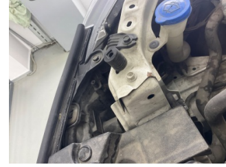
Kaporta, Ön Panel > Hasarlı