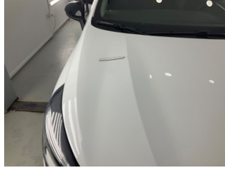
Motor kaputu, Motor kaputu > Ezik