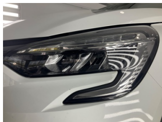
Farlar, Far, sol > Taş Izi