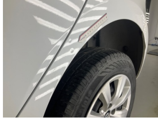
Çamurluk, sol arka, Çamurluk, sol arka > Ezik