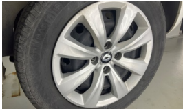
Jant kapağı seti > Hasarlı