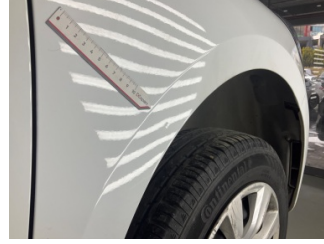
Çamurluk, sağ, Çamurluk, sağ > Ezik