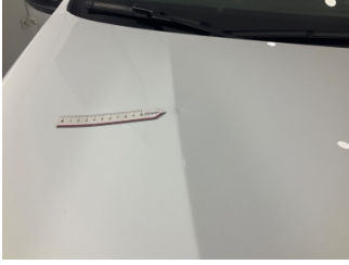
Motor kaputu, Motor kaputu > Ezik