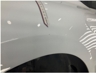
Çamurluk, sol, Çamurluk, sol > Ezik