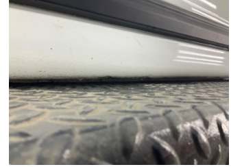
Marşbiyel, sol, Marşbiyel, sol > Ezik