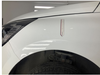
Çamurluk, sol, Çamurluk, sol > Ezik