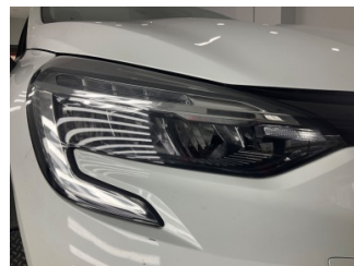
Farlar, Far, sağ > Taş Izi