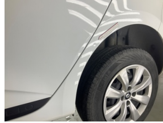
Çamurluk, sol arka, Çamurluk, sol arka > Ezik