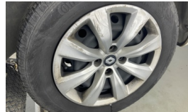
Jant kapağı seti > Hasarlı