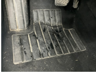
Taban, Paspaslar > Eksik