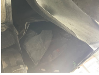
Arka bölüm, Arka sac/panel > Hasarlı