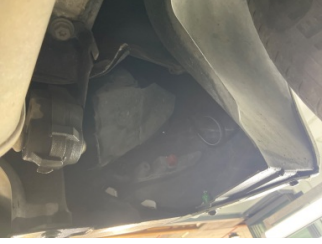
Arka bölüm, Arka sac/panel > Hasarlı