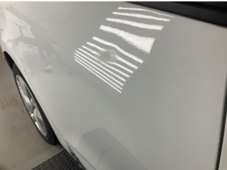
Kapı, sağ arka, Kapı, sağ arka > Deforme Olmuş