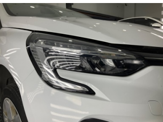
Farlar, Far, sağ > Taş Izi