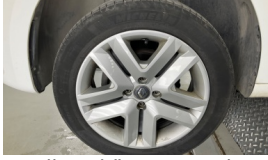
Lastik, sol ön > Hasarlı