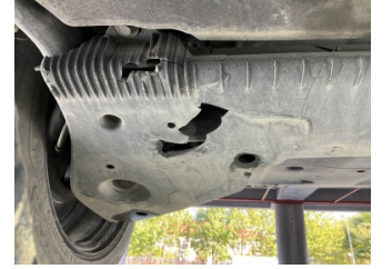
Kaporta, Muhafaza, arka > Hasarlı