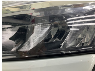
Farlar, Far, sol > Taş Izi