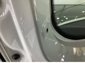
Döşemeler/Kapaklar, Döşemeler/Kapaklar > Eksik