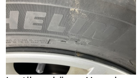
Lastik, sol ön > Hasarlı