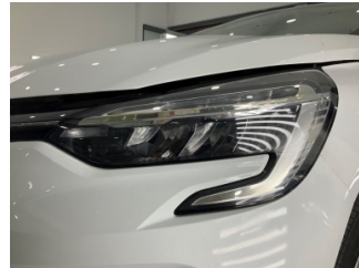
Farlar, Far, sol > Taş Izi