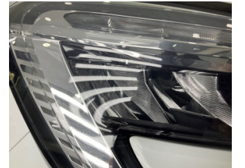
Farlar, Far, sağ > Taş Izi