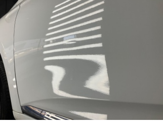
Kapı, sol ön, Kapı, sol ön > Ezik