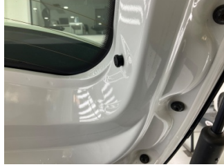
Döşemeler/Kapaklar, Döşemeler/Kapaklar > Eksik