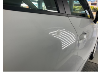
Kapı, sağ arka, Kapı, sağ arka > Ezik