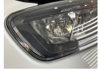
Farlar, Far, sol > Taş Izi