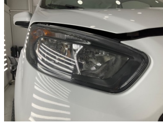
Farlar, Far, sağ > Taş Izi