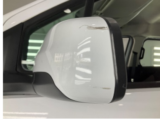
Dikiz aynası, sol, Dış dikiz aynası kapağı > Çizik