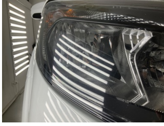
Farlar, Far, sağ > Taş Izi