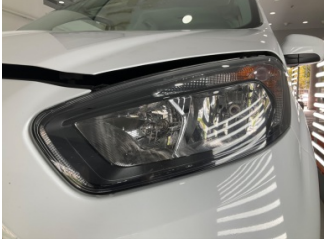
Farlar, Far, sol > Taş Izi