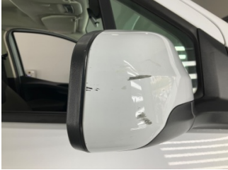
Dikiz aynası, sağ, Dış dikiz aynası kapağı > Çizik