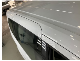
Tavan, Sağ üst frangart > Dolu Hasarlı