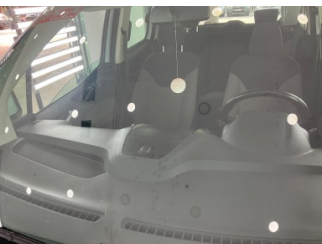
Camlar, Ön cam > Taş İzi