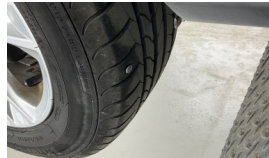
Lastik, arka > Hasarlı