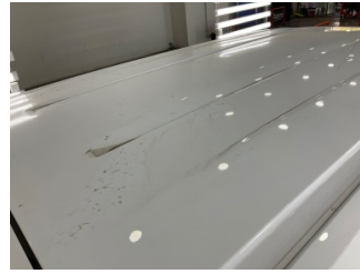
Tavan, Tavan > Dolu Hasarlı