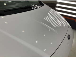
Motor kaputu, Motor kaputu > Dolu Hasarlı