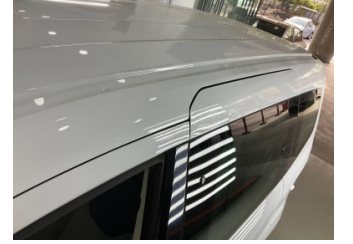
Tavan, Sol üst frangart > Dolu Hasarlı