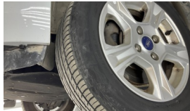
Lastik, sol ön > Onaysız