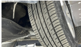
Lastik, sol ön > Aşınmış