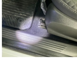
Taban, Taban halısı > Yakıcı Madde ile Zarar Görmüş