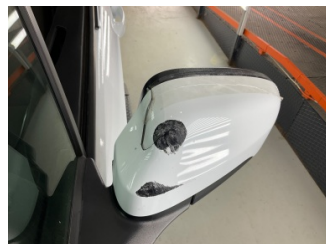
Dikiz aynası, sol, Dış dikiz aynası > Hasarlı