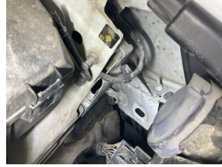
Kaporta, Sol Kılıç Sacı > Hasarlı