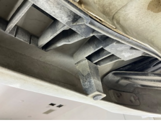
Tampon, arka, Bağlantı ayağı > Hasarlı