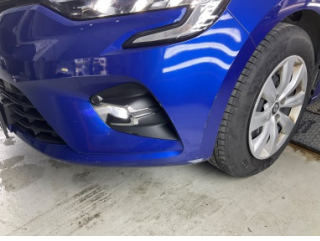
Tampon, ön, Ön tampon > Hasarlı