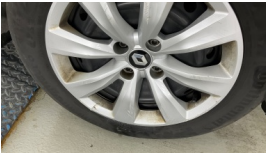
Jant kapağı seti > Hasarlı