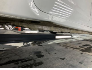
Marşbiyel, sağ, Marşbiyel, sağ > Ezik