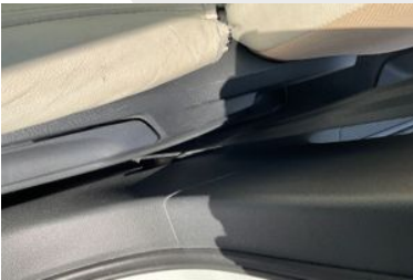
Orta direk bakaliti hasarlı