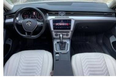
6. Araç için ön Konsol