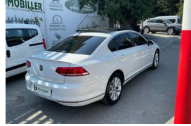
3. Sağ Arka Çapraz