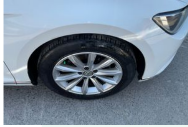
Sağ Ön Lastik