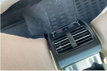
KALORİFER PETEK IZGARALARI