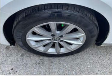
Sol Ön Lastik