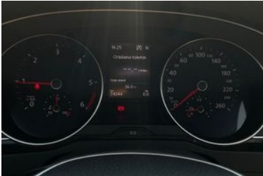
11. Araç için kadran