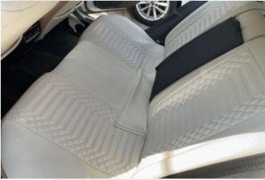
KOLTUK DÖŞEMELERİ VE AYAR DÜĞMELERİ