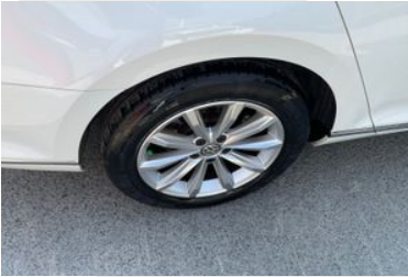
Sağ Arka Lastik