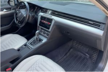
7. Araç için sağ ön sıra