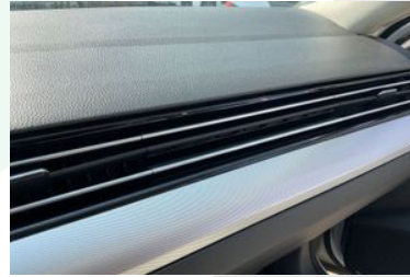
KALORİFER PETEK IZGARALARI