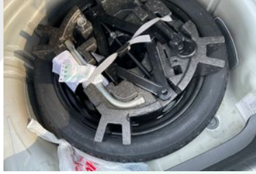
STEPNE VEYA TAMİR KİTİ