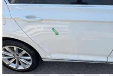
SAĞ ARKA KAPI