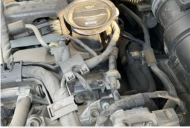
MOTOR YAĞ SIZDIRMAZLIĞI