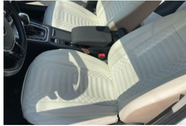
KOLTUK DÖŞEMELERİ VE AYAR DÜĞMELERİ