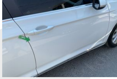
SAĞ ÖN DİREK