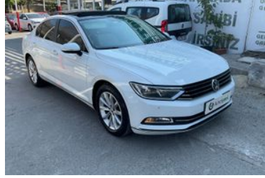
2. Sağ Ön Çapraz