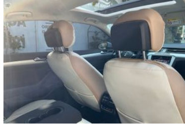
8. Araç için sağ arka sıra