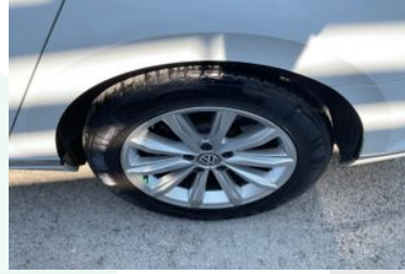
Sol Arka Lastik