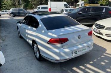
4. Sol Arka Çapraz