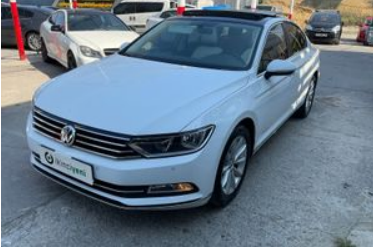
1. Sol Ön Çapraz