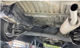
Stepne > Eksik