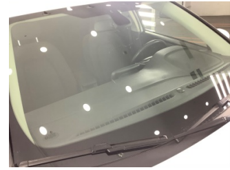
Camlar, Ön cam > Hasarlı