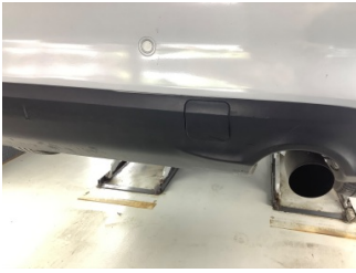
Tampon, arka, Spoiler > Hasarlı