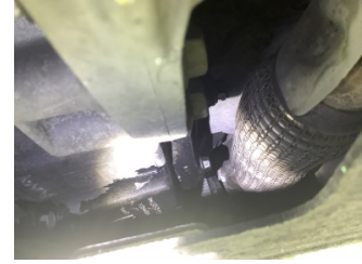
Motor, Motor > Yağ Kaçağı