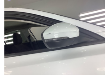
Dikiz aynası, sağ, Dış dikiz aynası kapağı > Çizik