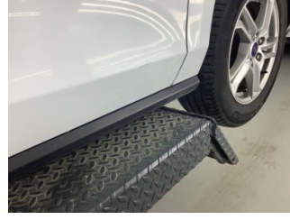
Kapı, sağ ön, Kapı, sağ ön > Ezik