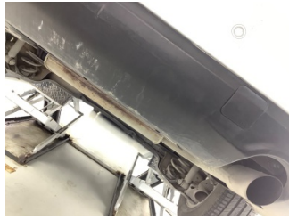
Tampon, arka, Spoiler > Hasarlı