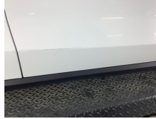
Kapı, sağ ön, Kapı, sağ ön > Çizik