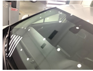
Camlar, Ön cam > Hasarlı