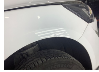
Çamurluk, sağ, Çamurluk, sağ > Ezik