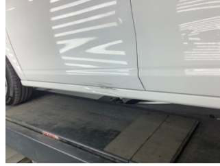
Marşbiyel, sol, Marşbiyel, sol > Hasarlı