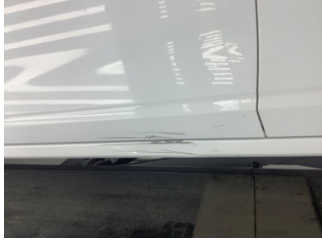
Kapı, sol ön, Kapı, sol ön > Hasarlı