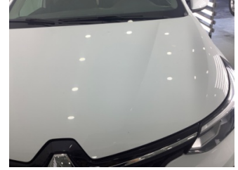
Motor kaputu, Motor kaputu > Taş Vuruğu