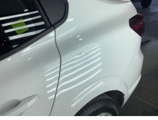
Çamurluk, sol arka, Çamurluk, sol arka > Ezik