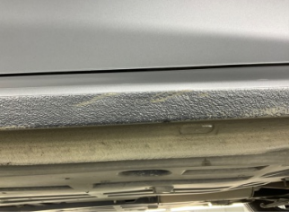
Marşbiyel, sağ, Marşbiyel, sağ > Ezik