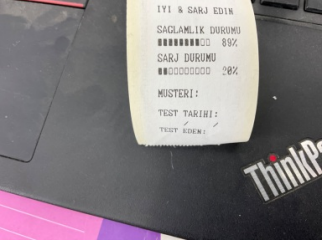
Elektrik donanımı/Pano, Akü > Test Sonucu