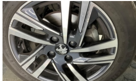
Jant, sağ ön > Çizik