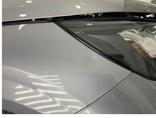
Çamurluk, sağ, Çamurluk, sağ > Ezik